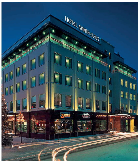
SANTA'S HOTEL SANTA CLAUS

N.B. I soggiorni di 4 notti includono un servizio di pulizia per tutta la permanenza. I soggiorni di 3 notti non prevedono il servizio di pulizia, che può essere acquistato facendone richiesta alla reception dell'hotel.