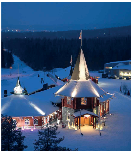
SANTA CLAUS HOLIDAY VILLAGE