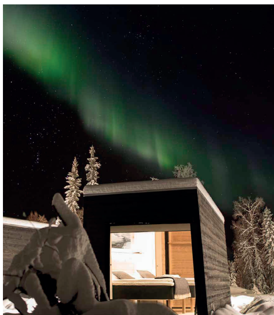
VAATTUNKI WILDERNESS RESORT