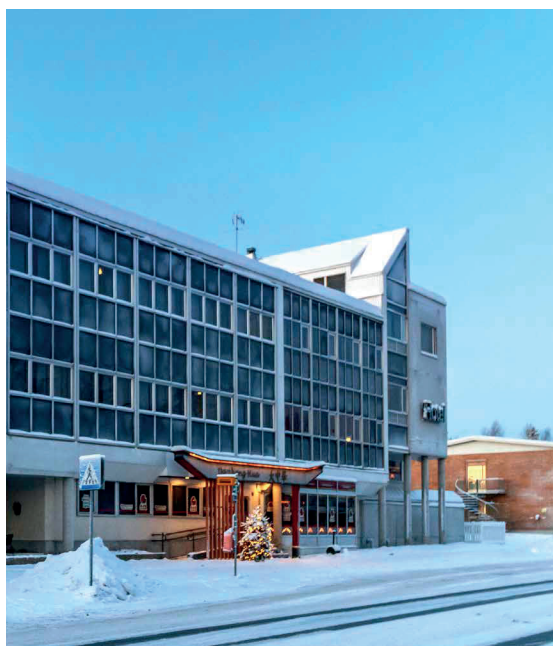
SANTA'S HOTEL RUDOLF

Il Vaattunki Wilderness Resort, situato a 25 km dal centro di Rovaniemi, è perfettamente immerso nella foresta artica, sulle rive del fiume Raudanjoki e alle porte dell'area escursionistica del circolo polare artico. Diversi tipi di sistemazione (25) offrono un soggiorno accogliente per coppie, famiglie e gruppi. Le tradizionali capanne di legno, gli accoglienti chalet in legno o le moderne capanne panoramiche situate nel mezzo della tranquilla natura selvaggia colpiscono ogni suo ospite. Le attività fruibili pernottando in questa struttura sono molteplici. Numerosi sentieri escursionistici partono dall'area del resort offrendo fantastici panorami da fotografare tutto l'anno. I più avventurosi potranno cimentarsi in esperienze uniche quali: i safari alla ricerca delle renne, guidare una motoslitte attraverso la natura selvaggia artica, provare la pesca sul ghiaccio o galleggiare sul ghiaccio e vivere l'aurora boreale.